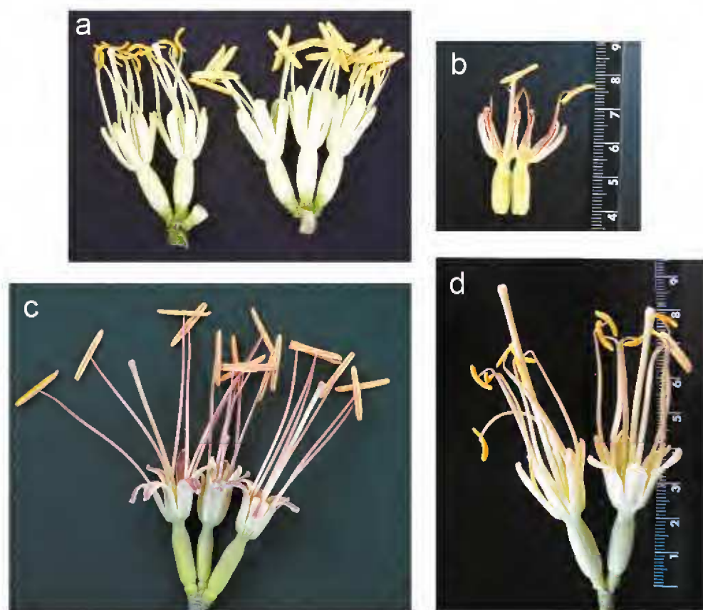
Fig. 3. Comparación de flores de: a. A. victoriae-reginae subsp. victoriae-reginae ; b. Agave victoriae-reginae subsp. swoboda , flor abierta longitudinalmente; c. A. nickelsiae ; d. A. pintilla .

Rosetas cespitosas, rara vez solitarias, no surculosas, acaules o con un tallo corto no visible (cubierto de hojas), hasta de 75 cm de diámetro y hasta 65 cm de alto, subcompactas o abiertas; hojas 170 a 280, de color verde grisáceo a verde opaco, con bandas blancas sobre las dos caras y los márgenes, puberulentas, oblongas, angostadas gradualmente hacia el ápice, no curvadas hacia el centro de la planta, dorsalmente aquilladas cerca del ápice o sobre la mitad distal de la cara abaxial, ventralmente cóncavas excepto hacia la base donde son gruesas y marcadamente convexas a aquilladas, 13-23 cm de largo y 5.5-8.5 cm de ancho; márgenes córneos, blancos, 3-5 mm de ancho, enteros, el margen continuo hacia la base y hacia el ápice o a veces desprendido en la mitad distal; ápice de la hoja redondeado, franja blanca apical inconspicua, 1(-2) mm de ancho, destacando el color negro de la espina; espina de color casi negro, piramidal a lanceolada, gruesa, 2-2.8 cm de largo, ampliamente acanalada por arriba y redondeadamente aquillada por abajo, la base amplia y marcadamente decurrente sobre los ángulos de la hoja, usualmente con 3 dientes adyacentes que coronan a los ángulos de la hoja; inflorescencia erecta, densa, el pedúnculo robusto, 4.5-6.5 m de alto y hasta de 6.5 cm de diámetro, con brácteas cartáceas, deltoides en la base, lineales, largamente atenuadas hacia el ápice; flores usualmente en grupos de tres, sobre pedicelos trifur-